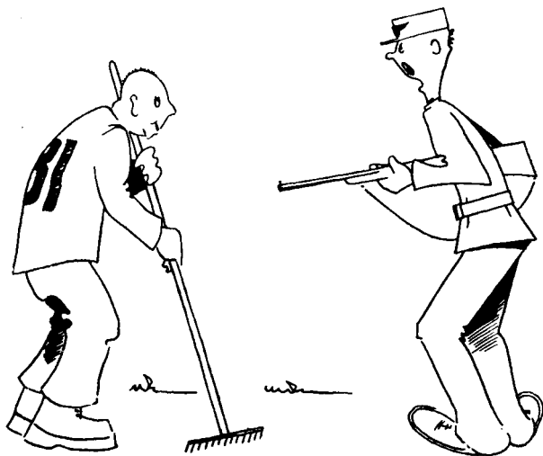
A R B' — din forbanna drittonge!

En dag nektet en som arbeidet på grøftelaget å gå ned i grøfta som var halvfull av vann. Da la vaktan an og skulle skyte, men en av de eldre stilte seg i veien. «Skal De endelig skyte, så skyt meg,» sa han, «for jeg holder så likevel ikke ut lenger!» Resultatet var en halv times straffeeksersis i sølevannet for hele laget. Prinsippet var alltid alle for en. Affæren ble rapportert til leirledelsen som så tok fra laget brødrasjonen for en dag. Å ta fra de sultne fangene maten for kortere eller lengre tid var i det hele tatt en meget effektiv og