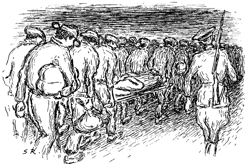
De første skritt mot gasskamrene — —. Jødene deporteres.

Den 26. om kvelden var det appell. Denne ebbet imidlertid ut uten at noe hendte, og fangene ble sendt inn igjen. Men det lå noe truende i luften. Denne følelsen ble ytterligere forsterket ved en historie som ét par av vokterne brygget sammen: At de allierte hadde gjort invasjon og at belegget på Berg av den grunn ville bli forflyttet i løpet av natten. Selv om alle var klar over at dette var en skrøne, hadde den sin virkning. Klokkene 4 om morgenen fikk hver utlevert to brød og seks sildekaker. Da skjønnte alle at det foresto en lang reise. Og da det kom ordre om at yttertøy, gummistøvler og beksømsstøvler skulle bli igjen, var det klart at det gjaldt en reise ut av landet.